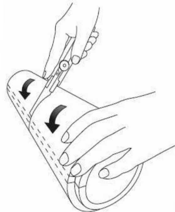
③パイプカバーを回転させながら切断